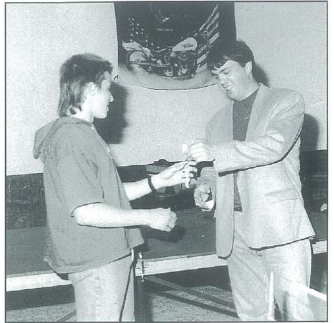
Remise des clés le jour de l'ouverture de la salle des jeunes.

L'assemblée générale aura lieu fin janvier, tous les membres y sont cordialement invités.