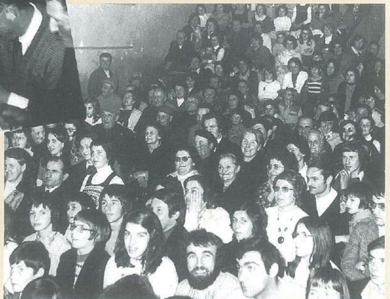
Ardoix jeunes - Au théâtre - 9 février 1975