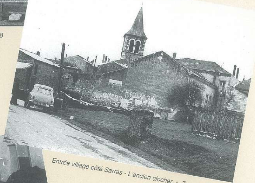
Entrée village côté Sarras - L'ancien clocher - 7 novembre 1957