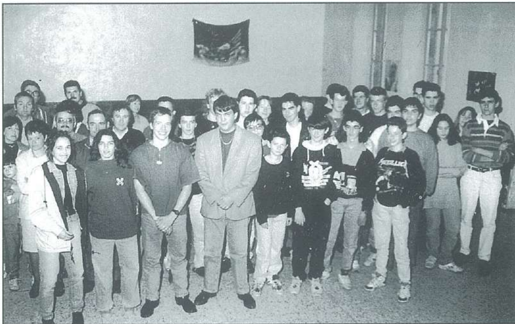
L'assemblée réunie au cours de cette sympathique cérémonie.