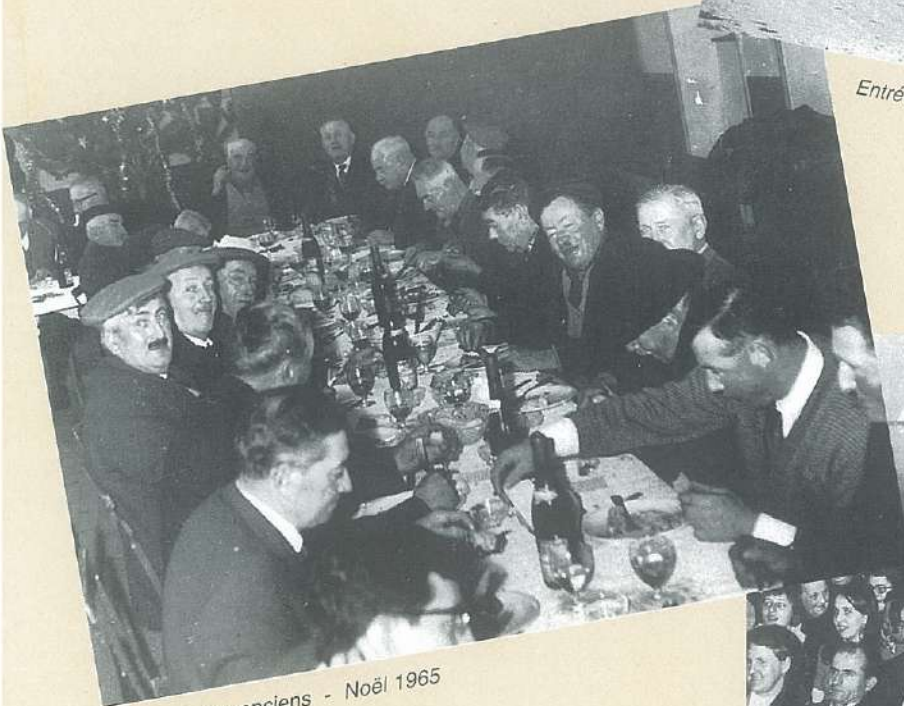
Repas des anciens - Noël 1965